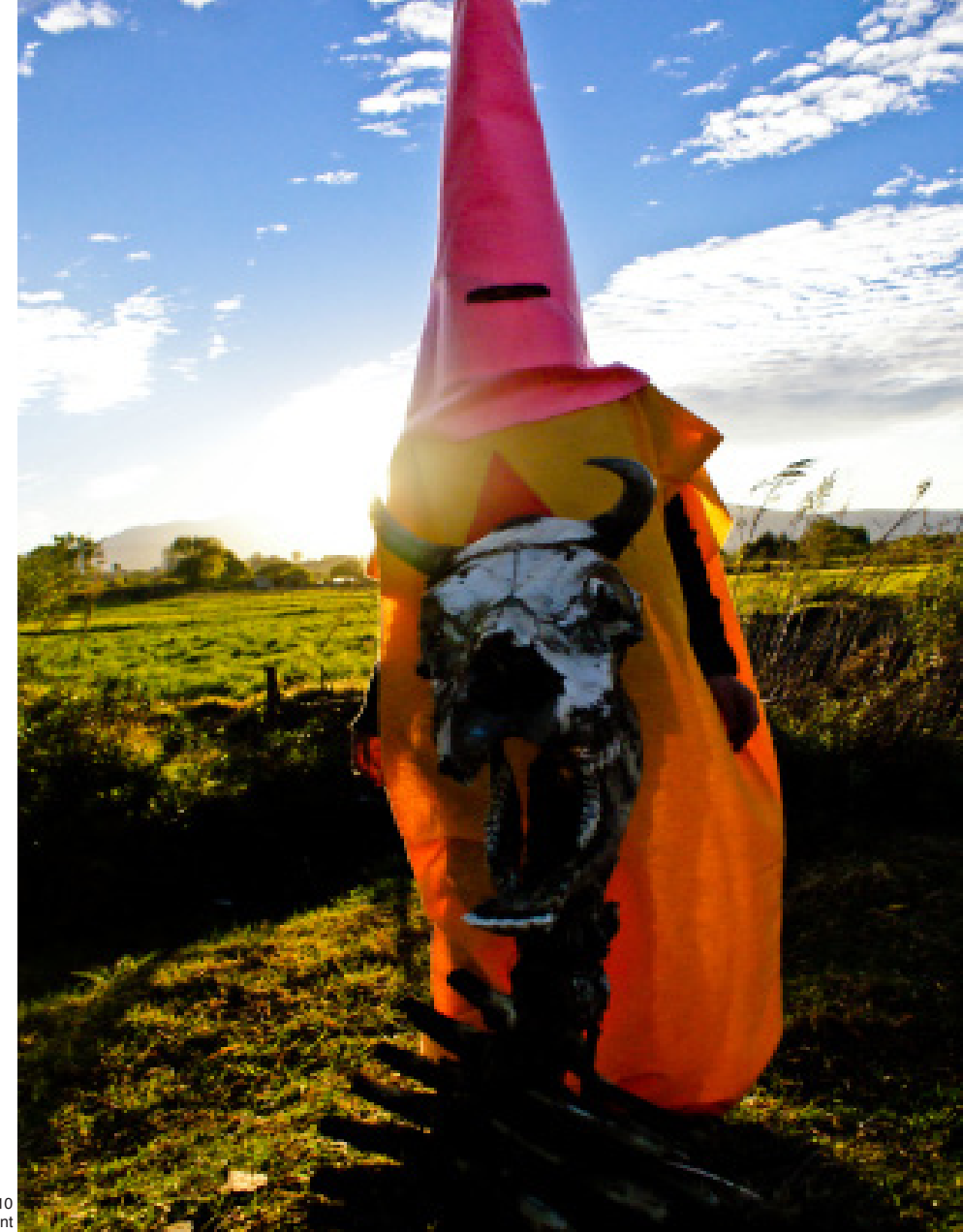
Bruja , 2010 Archival Inkjet Print

Castañeda es un graduado reciente de La Esmeralda, Escuela Nacional de Pintura, Escultura y Grabado, donde estudió dibujo y la fotografía. Ella recibió recientemente una plaza en el programa Nuevos Artistas en Residencia Skagdstrand, Islandia, donde ella será patrocinado por Jumex