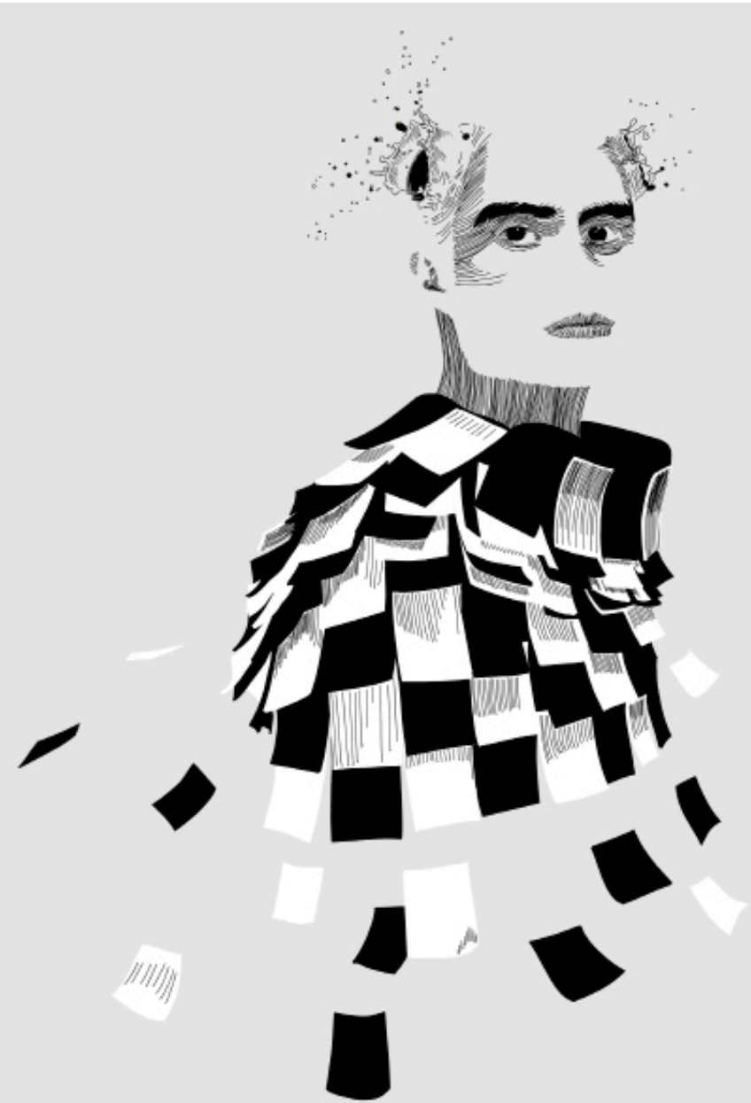
Autoretrato, 2010 Vinyl on Glass

En obras mayores Velmor estaba documentando la parte más vulnerable de la vida nocturna gay de Ciudad de México toma fotografías de las zonas de cruce y los balnearios y hoteles de los hombres que sirven como señuelo para el sexo express. El trabajo fue documental y en este trabajo Velmor escapa de que en su intento de averiguar a dónde ir ahora por modificar su práctica conceptual y técnicamente. Ricardo Velmor es egresado de La Esmeralda, Escuela Nacional de Pintura, Escultura y Grabado. También es editor en jefe de la revista Anal.