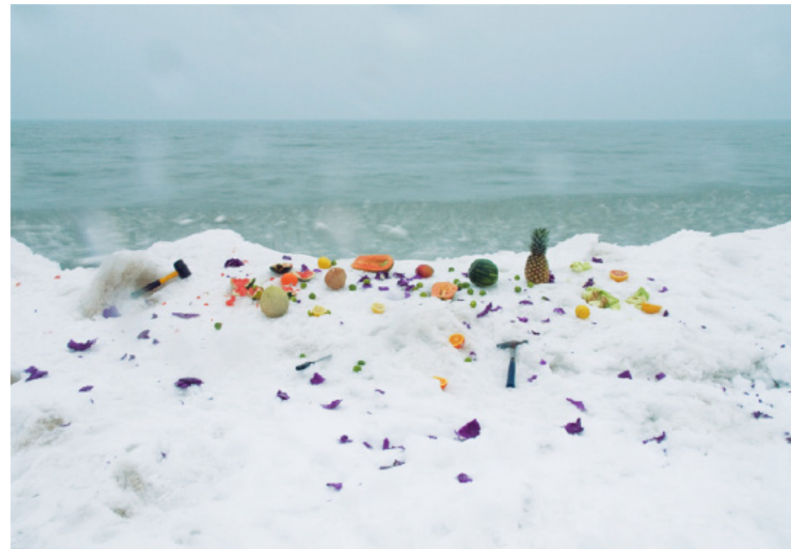
Just Me and My Melons , 2009 Archival Inkjet Print

Sara Condo es una artista que está interesada en volver a examinar las experiencias de su vida personal a través de fotografía. En esta exposición ofrece un muestreo en algunas fotos nuevas que tienden a idealizar los objetos cotidianos y reconocibles. En Kate (2010) Condo crea un retrato hermoso que es un guiño evidente para una generación más antigua de fotógrafos, al mismo tiempo traer de vuelta la belleza al arte contemporáneo. En Just Me and My Melons (2010) se adopta un enfoque similar a fotografiar destrozado en medio de una fruta tropical congelada del lago Michigan creando una escena que deja al espectador confundido, pero seducido por la imagen, al mismo tiempo. En su trabajo anterior Condo había documentado su familia en su casa en los suburbios de Chicago, con una madre con trastorno bipolar. Recientemente se graduó de la Escuela del Art Institute de Chicago con un BFA en fotografía.