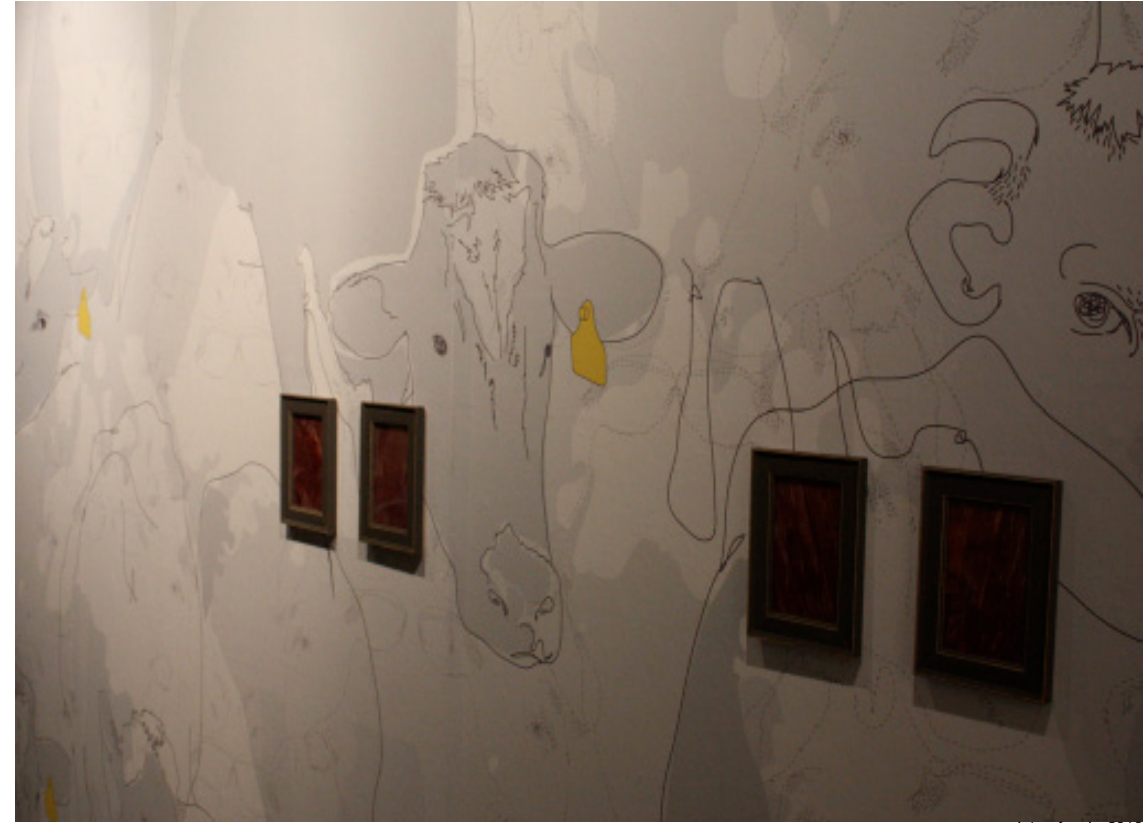
Interferencia. 2010 Installation; wall paper and framed photographs