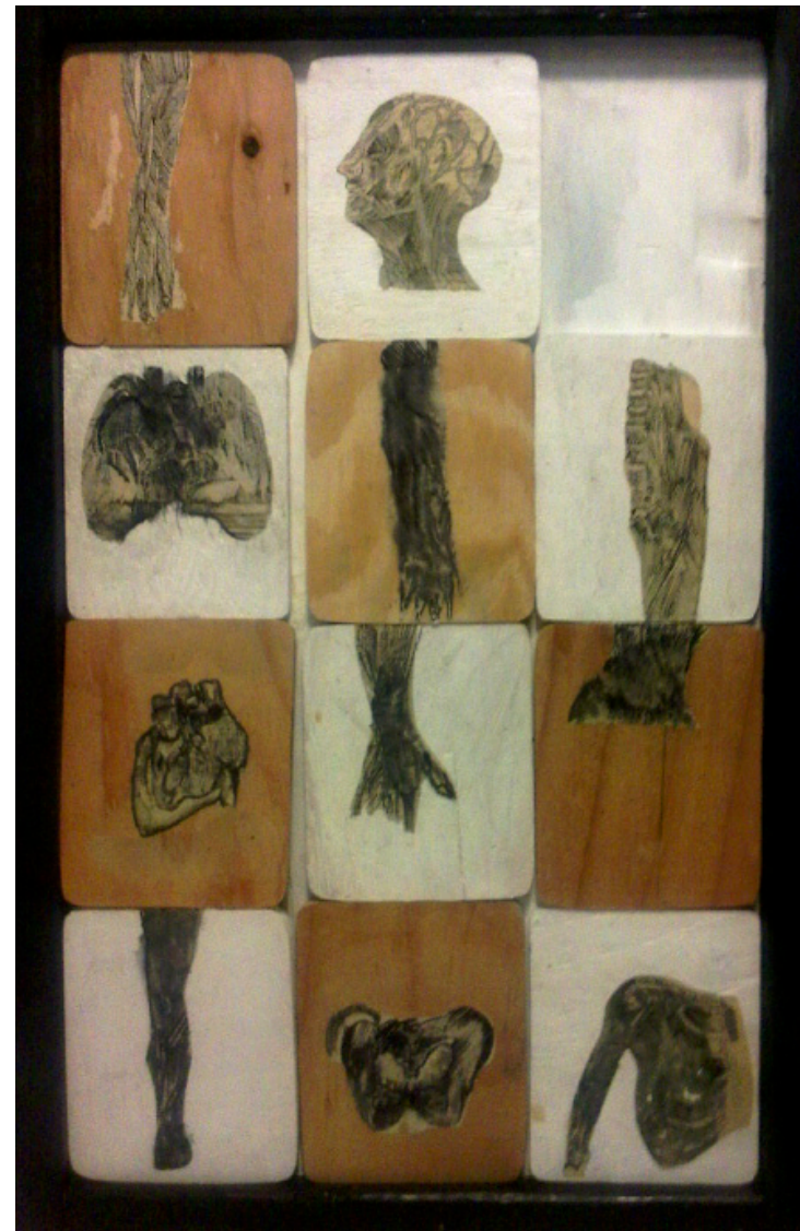
Percipience , 2010 wood, ink, acrylic paint